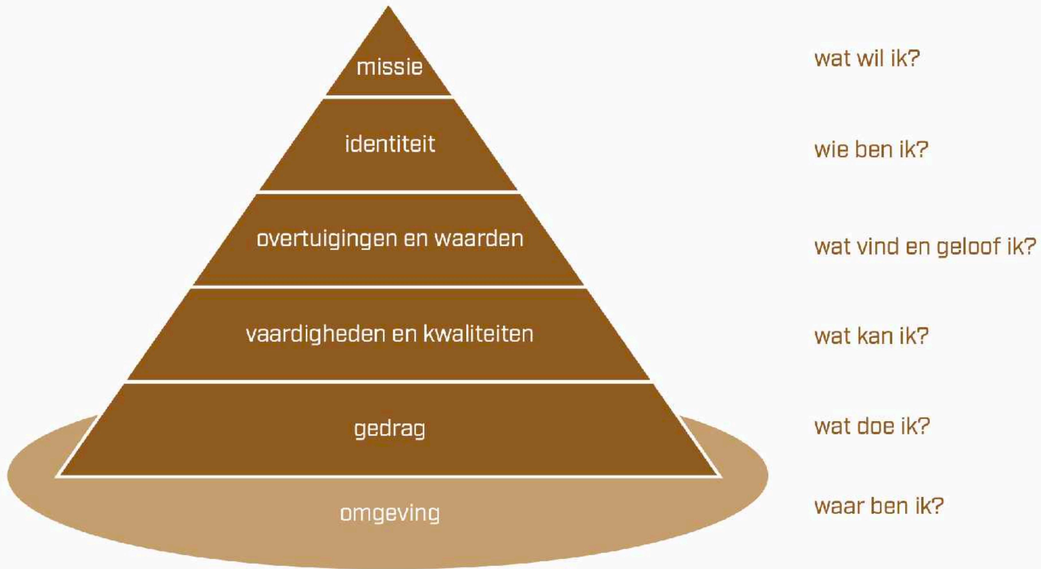
Figuur 6.1 Model van de logische niveaus met de kernvragen per niveau